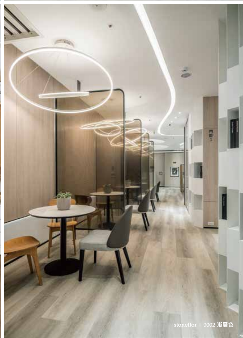
stoneflor | 9002 漸層色