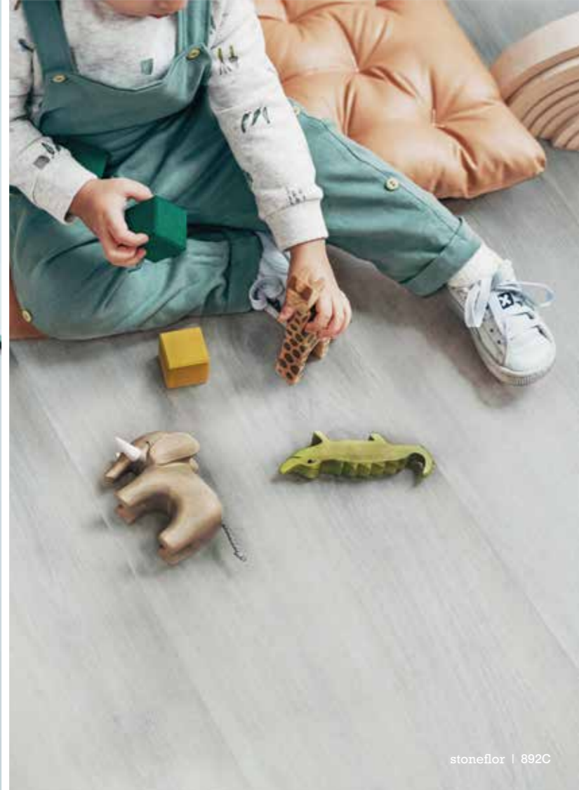
stoneflor | 8920