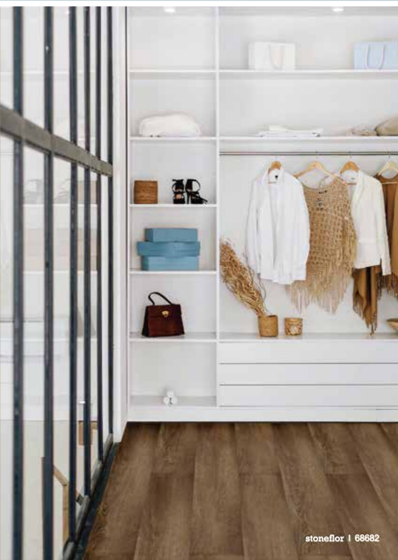
stoneflor | 68682

Enjoy your own life without comparing it with that of another.