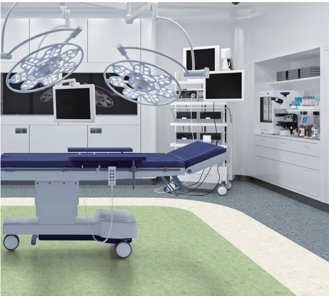
SM01212 + SM01201 + SM01225