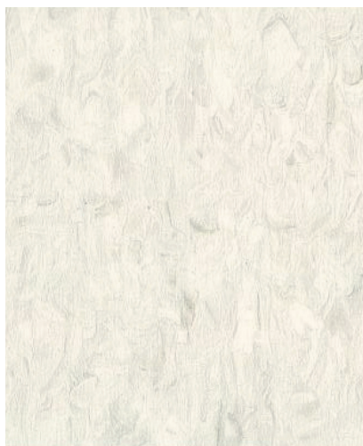
SM01201 SNOW WHITE