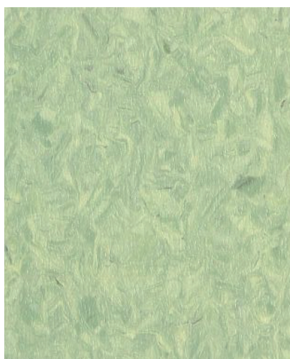
SM01212 BUD GREEN