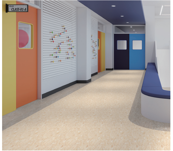
SM01207 + SM01208