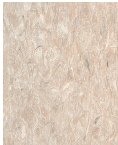
SM01208 YAK BONE